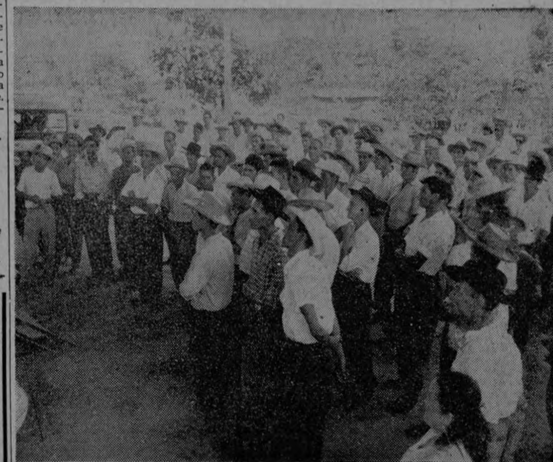
Vista parcial de la concentración de cosecheros de Tabaco de Puriscal.