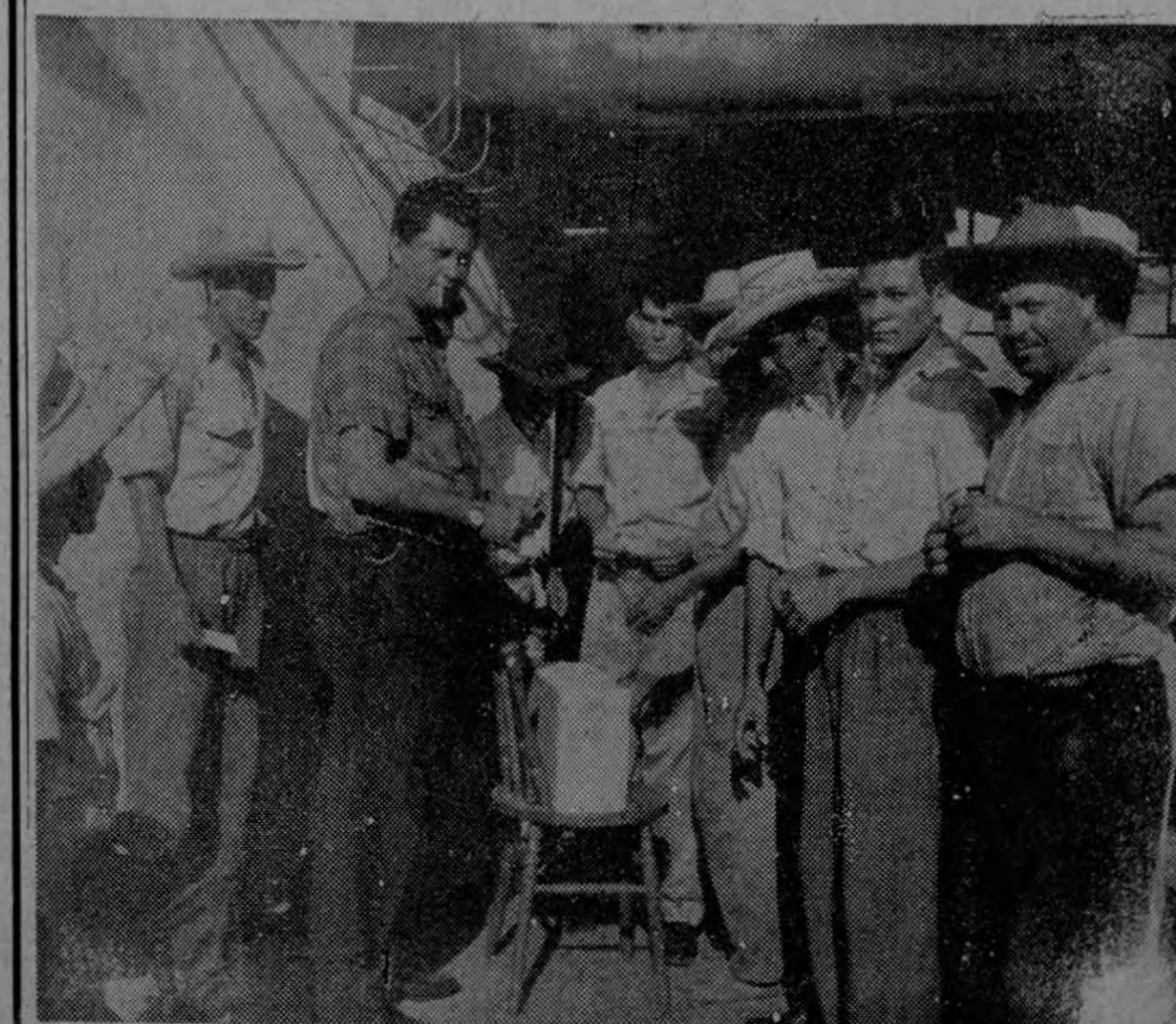
Cosecheros depositando sus votos en favor de las candidatas del cantón.